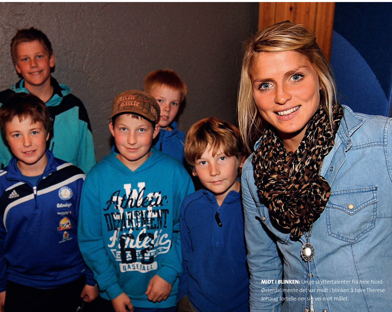
MIDT I BLINKEN: Unge skyttertalenter fra hele Nord-Østerdal mente det var midt i blinken å høre Therese Johaug fortelle om sin vei mot målet.